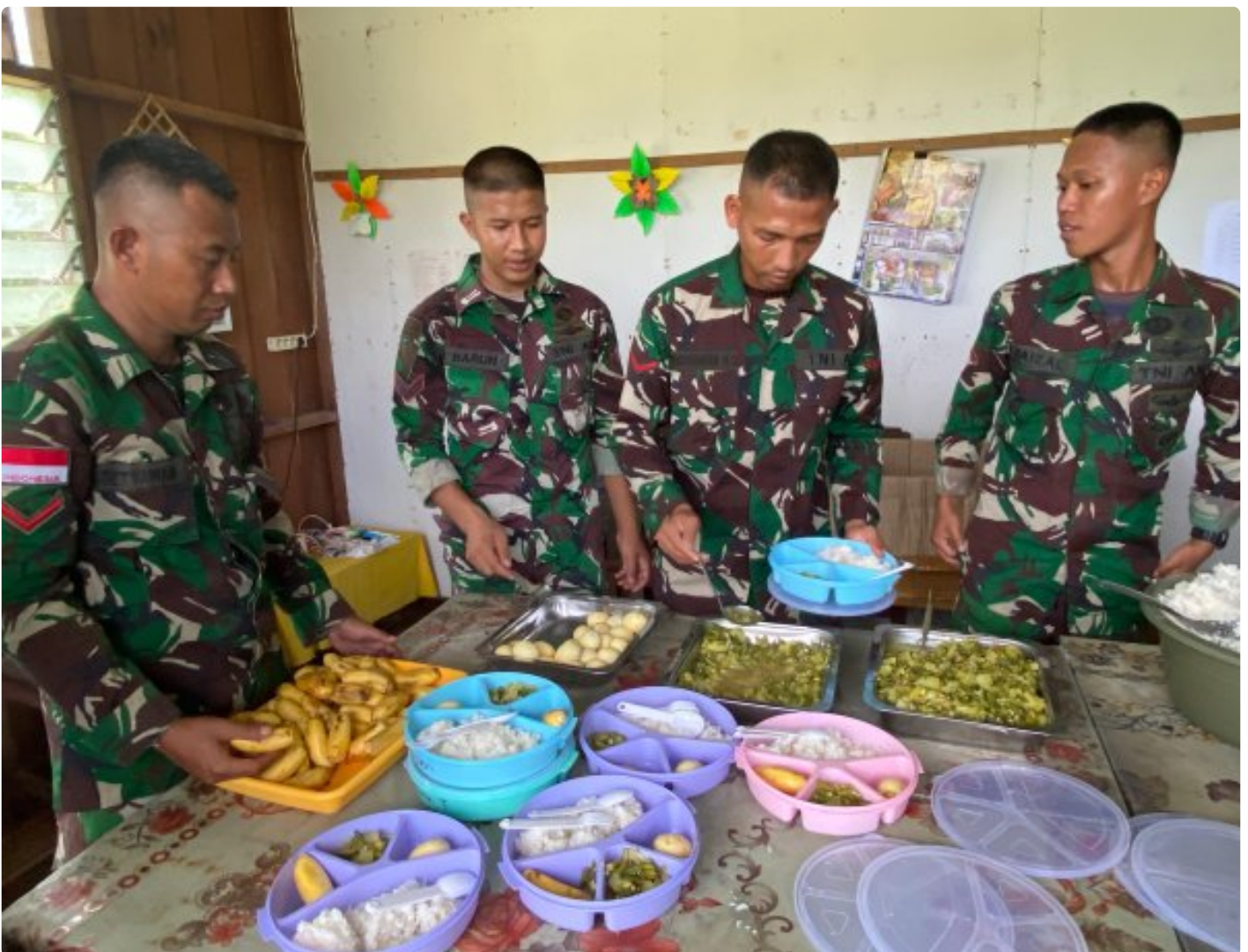
Foto: Dedikasi Satgas Pamtas Mobile RI-PNG Yonif 503/Mayangkara dalam mendukung program makan bergizi gratis pemerintah mendapat apresiasi tinggi dari masyarakat Distrik Krepkuri, Kabupaten Nduga, Papua, di sekolah rimba, Rabu (29/01/2025).

NDUGA- Dedikasi Satgas Pamtas Mobile RI-PNG Yonif 503/Mayangkara dalam