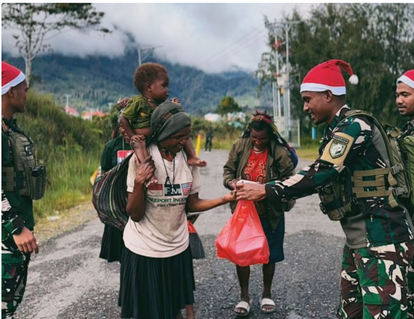
Foto: Satgas Yonif 509 Kostrad memberikan makna baru pada patroli keamanan dengan berbagi kebahagiaan bersama masyarakat di Intan Jaya, Papua.

PAPUA- Dalam balutan semangat Natal yang damai, Satgas Yonif 509 Kostrad memberikan makna baru pada patroli keamanan dengan berbagi kebahagiaan